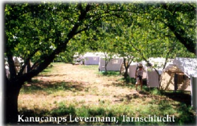
Kanucamps Levermann, Tarnschlucht